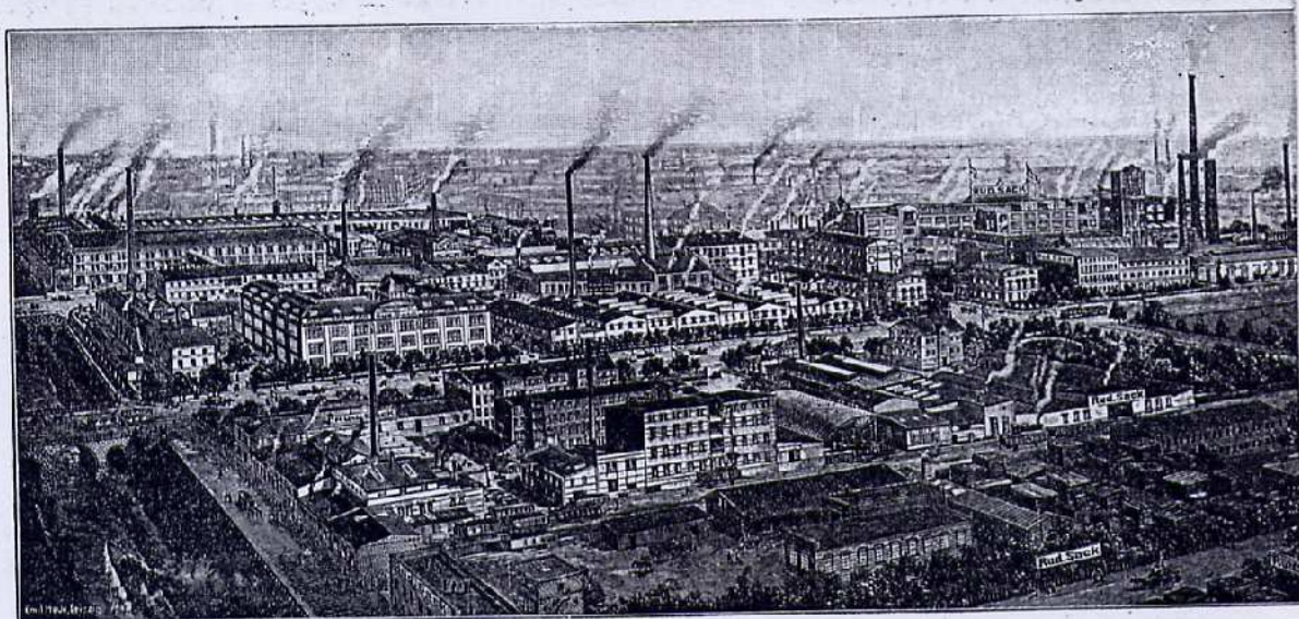
Fabrik für Geräte und Maschinen zum Ackerbau von RUD. SACK, Leipzig-Plagwitz. Die Fabrik nimmt einen Flächenraum von 75 000 Quadratmeter ein und beschäftigt 2000 Arbeiter und Beamte. Außerdem besitzt die Firma Rud. Sack noch 2 Versuchsgüter in der Größe von 200 ha.